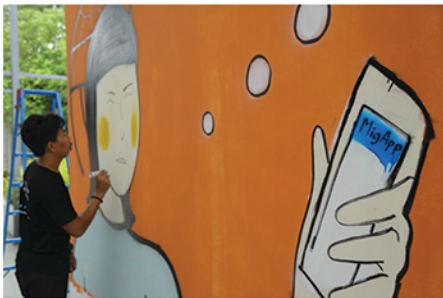
ဂရပ်ဖစ်အနုပညာရှင်များက နံရံပေါ်တွင် ရေးဆွဲနေကြစဉ်