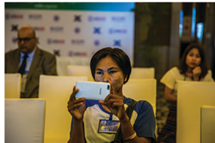
တက်ရောက်လာသည့် ဧည့်သည်တော်တစ်ယောက်မှ အမှတ်တရဓာတ်ပုံရိုက်ကူး