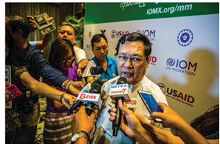
ပြည်ထောင်စုဝန်ကြီးဦးသိန်းဆွေ သတင်းမီဒီယာများအား ဖြေကြားစဉ်