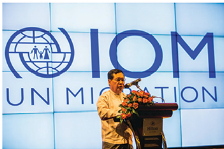
ပြည်ထောင်စုဝန်ကြီးဦးသိန်းဆွေ က အခမ်းအနား ဖွင့်လှစ်

မီဒီယာ အခမ်းအနားသို့သတင်းတိုက် ၁၂ တိုက်က သတင်းထောက် ၂၀ ဦး အပါအဝင် စုစုပေါင်း ၇၅ ဦးတက်ရောက်ခဲ့သည်။ အခမ်းအနား အကြောင်း သတင်းနှင့် ရုပ်သံတင်ဆက်မှုပေါင်း ၁၀ ခုကျော်ရှိခဲ့ပြီး လူထုဆက်သွယ်ရေးတန်ဖိုး အမေရိကန် ဒေါ်လာ ၅၄၉၀ နှင့်ညီမျှသည်။