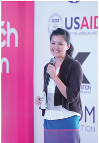
မိချိုကိုအိတို၊ Programme Manager Labour Mobility and Human Development, IOM Myanmar