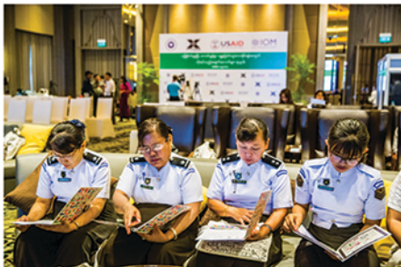
အခမ်းအနားတက်ရောက်လာသော အစိုးရဌာနများမှ ပုဂ္ဂိုလ်များ