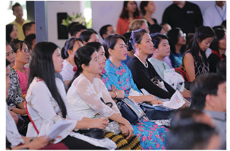
ဧည့်သည်ပေါင်း ၂၀၀ ကျော်တက်ရောက်ခဲ့